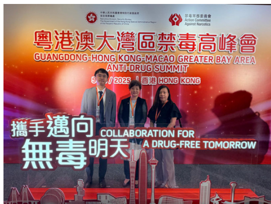
粵港澳大灣區禁毒高峰會 - 攜手邁向無毒明天