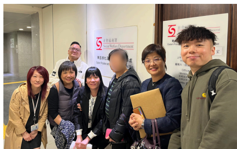
到東區感化辦事處介紹服務