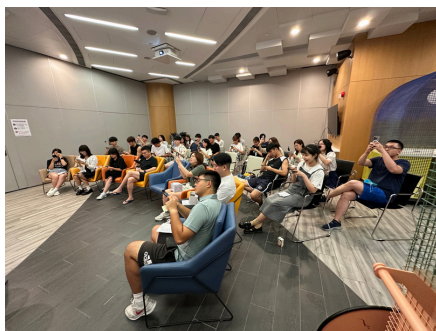
保良局李兆基青年綠洲 向在職青年宣揚禁毒訊息