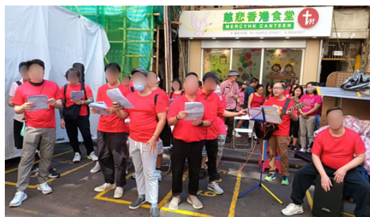
本會義工與慈悲香港的義工 透過歌聲與分享在廟街宣揚 抗毒與愛的訊息