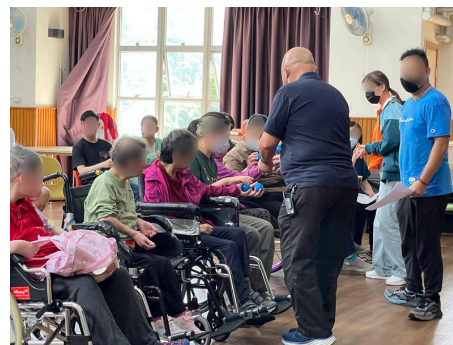
快樂大使義工隊到鄰舍輔導會怡 欣山莊服務智障的院友